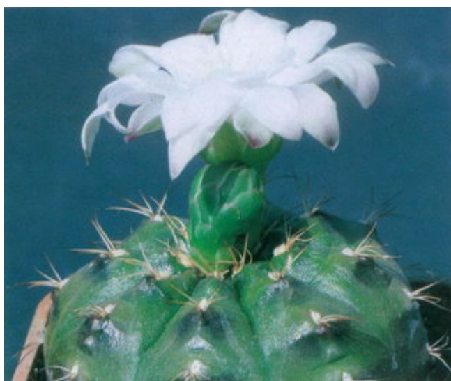
Figure 15 : Gymnocalycium anisitsii (le G. damsii var. rotundulum de Backeberg)

Mais l'aide est à portée de main, comme l'atteste le groupe autrichien dissident qui a élaboré une belle solution de compromis pour les "splitters" 3) qui sont parmi nous - je conseille à ce propos aux